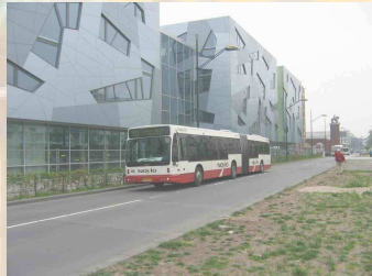
Niederländischer Linienbus vor dem ROC Nijmegen