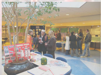
Beratung beim ‚Open dag‘

Infos der IB-Groep auch unter www.ib-groep.nl